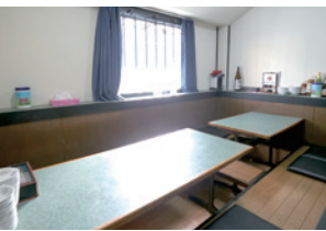
ファミリーに嬉しい座敷もあり。