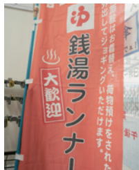
ジョギング中の荷物を預かってもらえる。