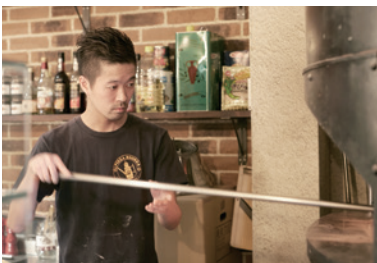
「地元で面白い店を増やしたい」と西田辺に出店。