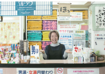
笑顔の女将がお出迎え。駄菓子コーナーも充実。