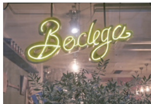
軽快なネオンに幅広い層が集う。