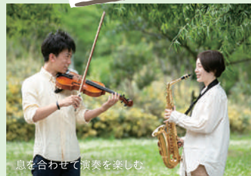
息を合わせて演奏を楽しむ

学生時代のサークルで一緒だった2人が、ここで楽器の練習を始めたのは昨年。コロナの影響で大学で練習できなくなって、よく来た頃は毎日ここで練習していました。木陰も多いので、夏でも意外と涼しいです。