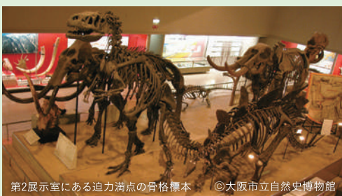
第2展示室にある迫力満点の骨格標本

お知らせ 11月から2022年の3月まで、リニューアル改修工事のため休園予定。2021年度の年間パスポートの有効期限は当年10月末まで。