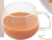
自家製の甘酒を使ったスパイシー甘酒チャイ495円