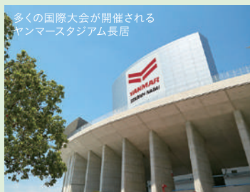
多くの国際大会が開催されるヤンマースタジアム長居

国際的な大会が開催される陸上競技場が2つもある公園は国内でも唯一。65.7haの総面積の敷地内にはほかに球技場、プール、テニスコート、なんと相撲場まで。長居公園がスポーツに特化した公園に至る歴史は古く、大阪市が総合公園の画期的な整備計画を決定したのが1928年。長居