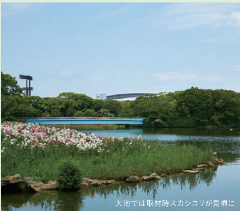
大池では取材時スカシユリが見頃に

大阪湾に流れ着いたというナガスクジラの骨格標本や、約2万年前まで大阪を歩いていたとされるナウマンゾウの復元模型など、大胆に空間を使ったダイナミックな展示は圧巻！その巨大なクジラの標本はこの学芸員により何年も掛けて作られたというから驚き。さらに昆虫から魚、菌類、植物、地質、化石まで、5つのテーマに分けて細かく展示。知る人ぞ知る、「友の会(年会費3000円)」は、ナイトミュージアムやバックヤードツアーなど魅力的な行事が多数。代々親子で参加する人も多いそう。