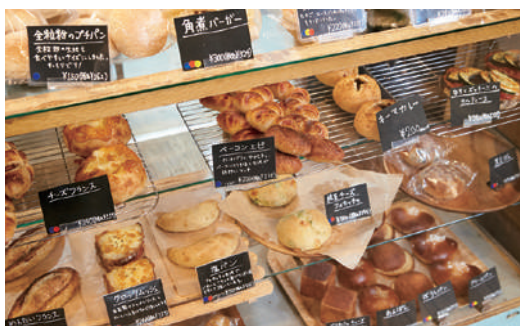
添加物やマーガリンは不使用。なすとズッキーニのタルティーヌ259円、スモークチキンサンド378円