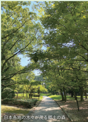
日本各地の木々が茂る郷土の森

公園と一言で言っても、競技場、植物園、博物館、と施設が充実。まずは全体をおさらい！