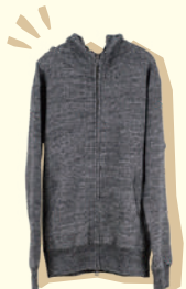
長く着続けたい DF定番パーカー 20,790円

デバイスファクトリー f i 大阪市東住吉区山坂5-16-20 TEL. 06-6170-6292 OPEN. 11:00~19:00(土・日は12:00~) CLOSE. 不定休 URL. https://devisfactory.jp/