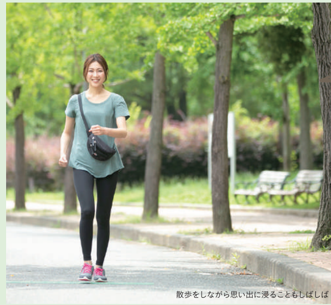
散歩をしながら思い出に浸ることもしばしば

大阪市住吉区長居2-10-32 TEL. 06-6696-5501 OPEN. 11:00~19:00 CLOSE. 水曜、木曜