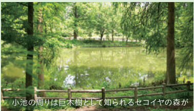
小池の周りには巨木樹として知られるセコイヤの森が

公園内の東南部、総面積の1/3以上を占める広大な植物園。夏のヒマワリや秋のコスモスなど、季節と共に表情が変わるライフガーデンやIIの専門園は、花好きにはお馴染み。野鳥が集まる550種以上の樹木の森や、植物園には珍しい大池など、ぐるっと一周するだけでおよそ1時間だから、年間パスポート(1000円)を購入して日々のウォーキングや森の中でランチなど、楽しみ方も様々。植物散策や観察だけでなく、電話や