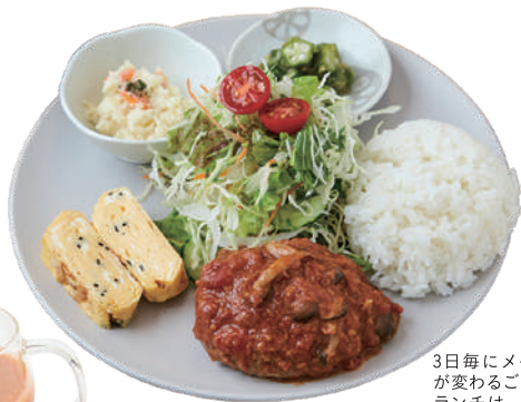
3日毎にメインが変わるごはんランチは、これにポタージュが付いて1,100円